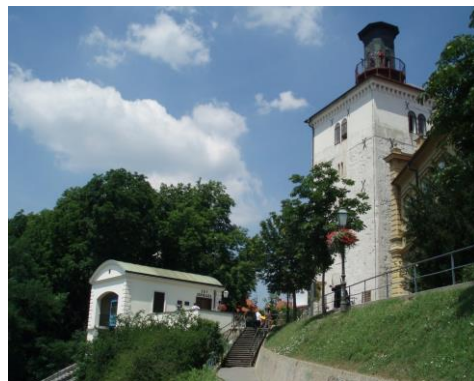
(8) ロトルシュチャク塔