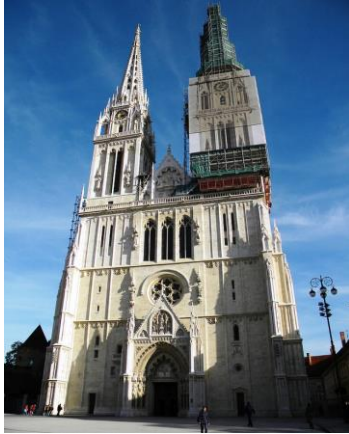
(4) 聖母被昇天大聖堂