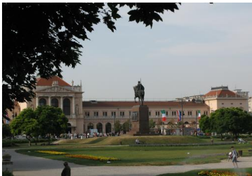
(1) 中央駅とトミスラブ広場

(2) ズリンスキ広場 (Trg N. Š. Zrinskog) : 中央駅から北側にある。1830年造設。トルコとの戦い(1566年)で戦死したズリンスキ将軍(1508~1566年)の300年祭を記念して彼の名が付けられた。大きなプラタナスが茂り, 夏も涼しい。公園の周りにクロアチア外務省, 日本大使館がある。